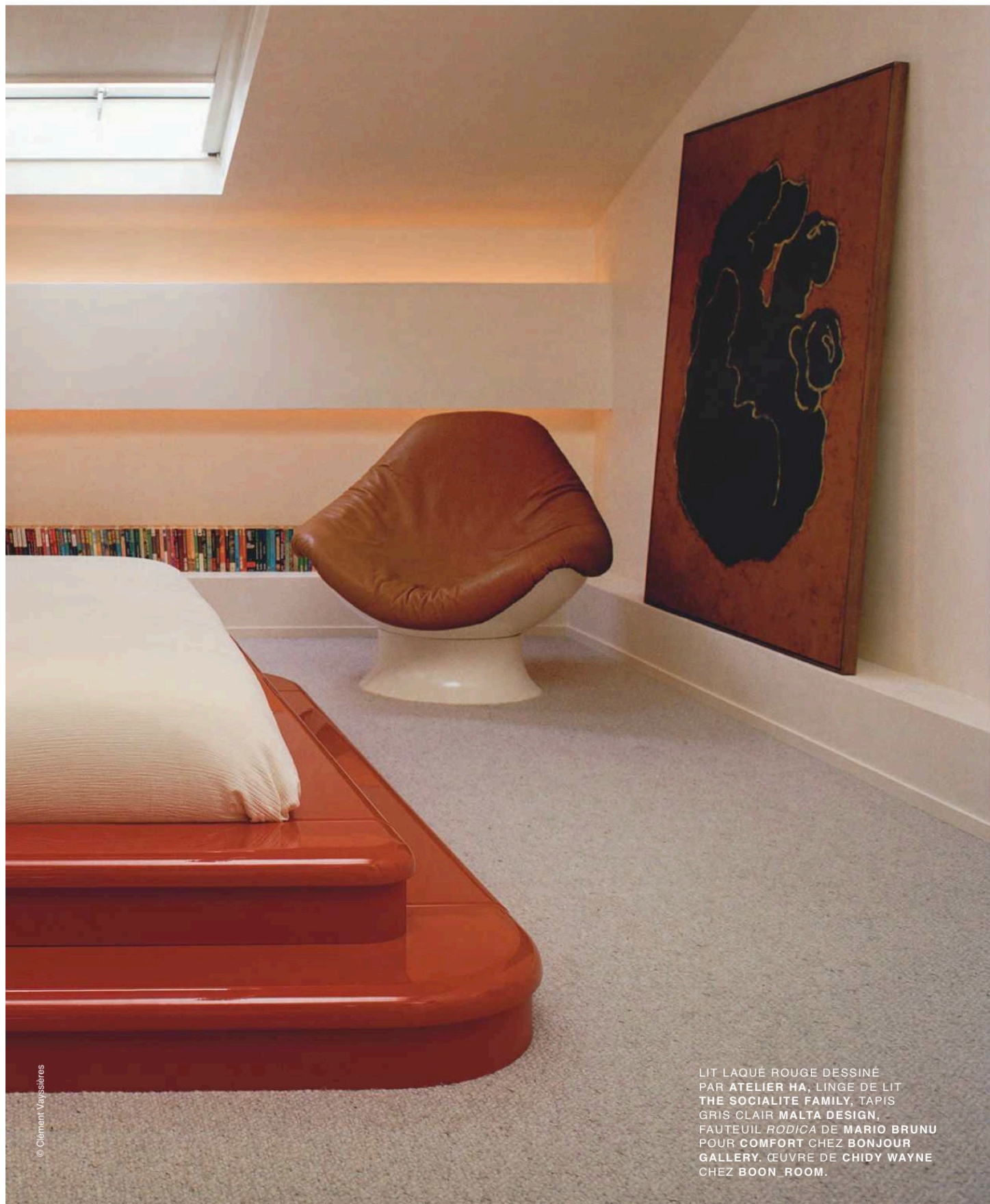
LIT LAQUÉ ROUGE DESSINÉ PAR ATELIER HA, LINGE DE LIT THE SOCIALITE FAMILY, TAPIS GRIS CLAIR MALTA DESIGN, FAUTEUIL RODICA DE MARIO BRUNU POUR COMFORT CHEZ BONJOUR GALLERY. ŒUVRE DE CHIDY WAYNE CHEZ BOON_ROOM.