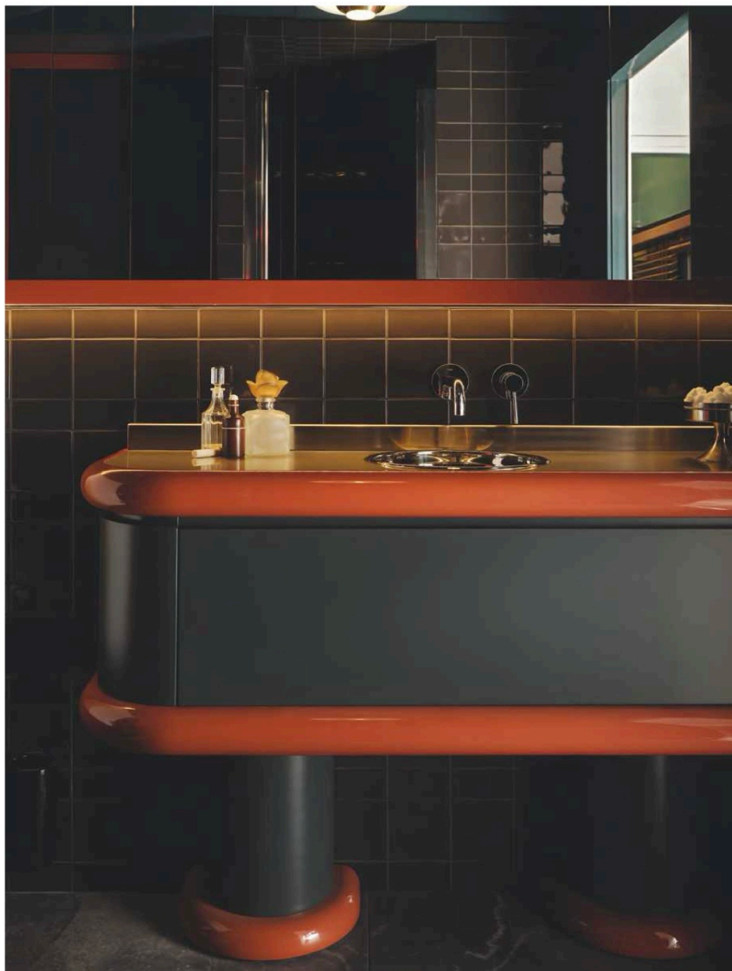
DANS LA SALLE DE BAINS, MEUBLE EN BOIS ET INOX DESSINÉ PAR ATELIER HA , REVÊTEMENT EN CARREAUX DE CIMENT VINTAGE. PAGE DE GAUCHE, DANS LA CHAMBRE, TISSU SINNY DE NOBILIS ET JEU DE MIROIRS AU PLAFOND, LIT EN LAQUE ROUGE ATELIER HA , SCULPTURE EN CÉRAMIQUE MATHIEU FROSSARD CHEZ BOON_ROOM .