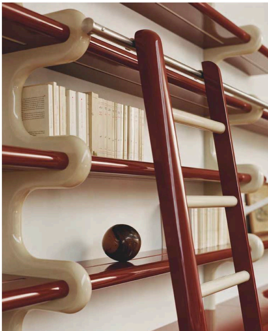
SUR LA MEZZANINE, BIBLIOTHÈQUE SUR MESURE EN BOIS LAQUÉ ROUGE ET CRÈME DESSINÉE PAR ATELIER HA . PAGE DE DROITE, FAUTEUIL EN CUIR SESANN DE GIANFRANCO FRATTINI PAR TACCHINI , PLAID INOUI ÉDITIONS . ŒUVRES DE L'ARTISTE CLÉMENT DAVOUT .